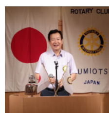
中 透 会長

7月1日から31日までの長い祭りとなり、17日のメインの山鉦巡業、24日の神輿渡御には外人客も