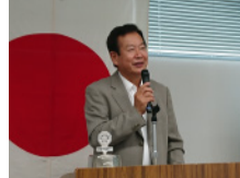
中 透 会長

「コロナウイルス肺炎のその後」 皆様お久しぶりです。緊急事態宣言後色々な会合が中止となり、ロータリークラブも例外ではありません。