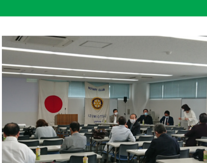
テクスピア大阪にて3密(3つの密)、密閉、密集、密接を避けての例会を開催いたしました。

今年4月には実務経験豊富なパートナー弁護士も加入し、今後も充実した法的なサービスをご提供できるようにしたいと思います。