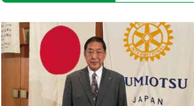
卓話講師 国際東洋医療学院 柔道整復師・鍼灸師