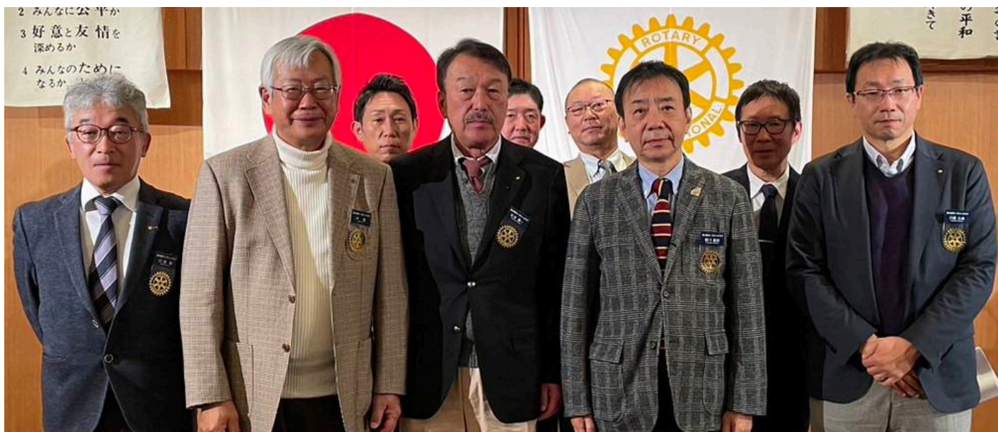
2025年～2026年度の理事役員